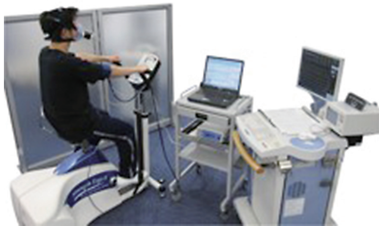
心肺運動負荷試験 (CPX)

急性期病院と回復期リハビリ病院（病棟）との連携により、心疾患の患者さまが急性期治療終了後に回復期リハビリ病院（病棟）でリハビリを実施することで、ADL・歩行速度等の向上が有意に図れることが報告されて